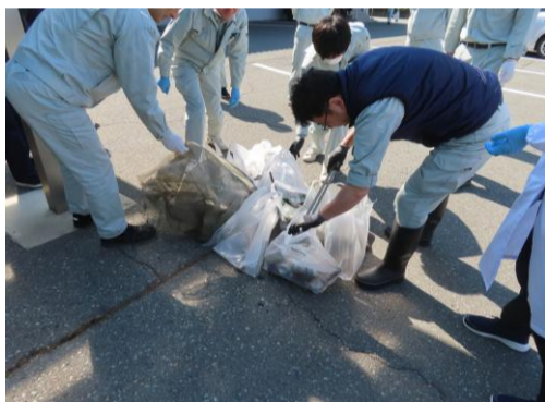
★会社周辺の清掃活動(4月)